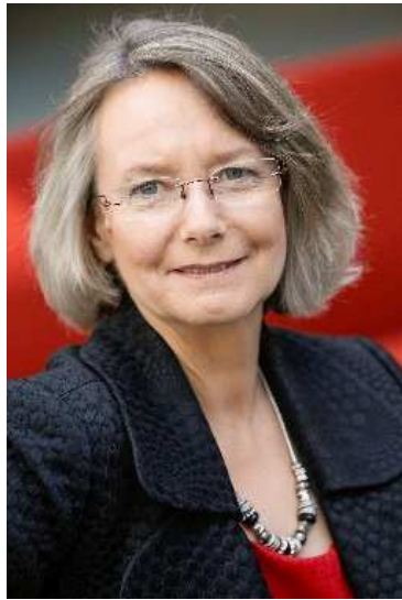
Evelyne Gebhardt MdEP

Am 25. Mai ist Europawahl - die zweitgrößte demokratische Wahl der Welt, bei der 400 Millionen Wahlberechtigte aufgerufen sind, die Weichen für Europas Zukunft zu stellen.