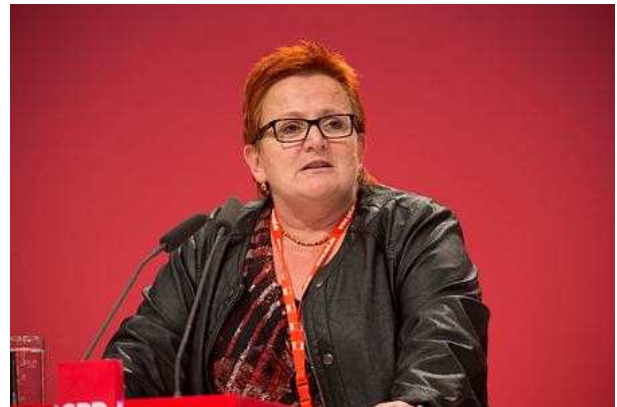
Elke Ferner