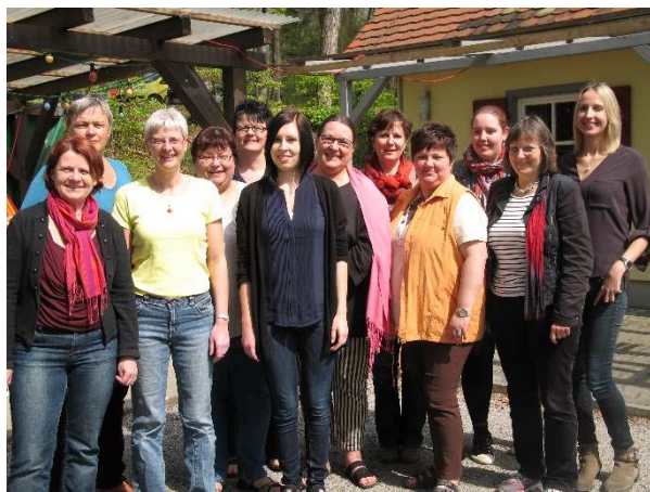
Gut gelaunte Klausurteilnehmerinnen vor dem Lemberghaus

Was machen 14 Frauen auf einem Haufen ein ganzes Wochenende lang? Genau - Kaffeetrinken. Wer sich bei diesem Gedanken ertappt hat, sollte flugs über die eigenen Vorurteile nachdenken.