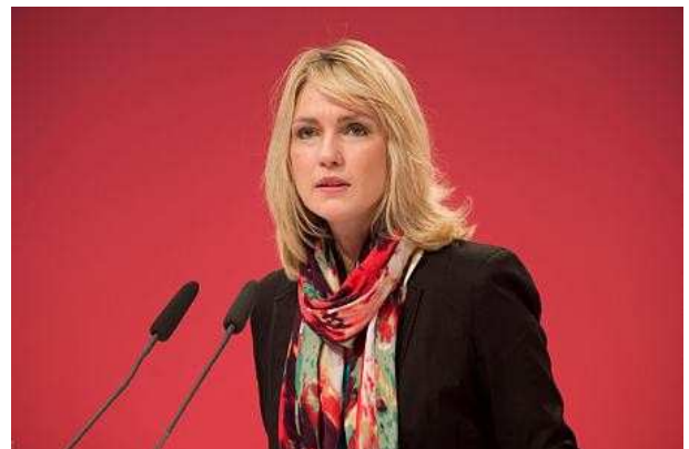
Manuela Schwesig

Es zeigt sich, dass Mütter ihre Erwerbstätigkeit immer kürzer unterbrechen. Bei Müttern von Kindern, die zwischen 2008 und 2010 geboren wurden, waren das durchschnittlich 19 Monate. Viele wären gerne noch früher wieder ins Erwerbsleben eingestiegen. Bei den Müttern mit Kindern zwischen ein und zwei Jahren arbeiten 41 Prozent wieder, der Anteil steigt auf 54 Prozent mit zwei- bis dreijährigen Kindern. Verglichen mit 2006 sind dies deutlich mehr. Außerdem arbeiten Mütter mittlerweile