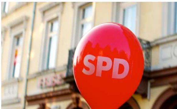
Jetzt gilt's: Endspurt zur Kommunal- und Europawahl am 25. Mai 2014

ASF WÜNSCHT ALLEN EINEN ERFOLGREICHEN WAHLKAMPF!